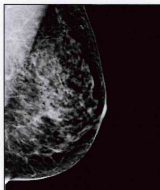
Categoría C: una mayor parte del seno conformado por tejidos densos glandulares y fibrosos. Esto podría hacer más difícil visualizar pequeños tumores alrededor de estos tejidos densos, los cuales también lucen como manchas blancas.