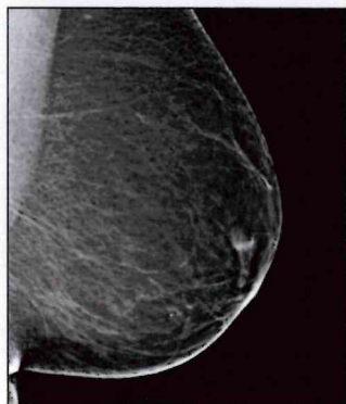
Categoría A: tejido adiposo casi en su totalidad.