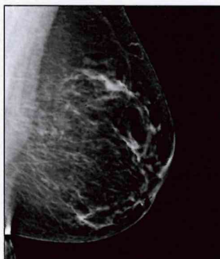
Categoría B: zonas dispersas con tejidos glandulares y fibrosos (que lucen como manchas blancas en las imágenes del mamograma).